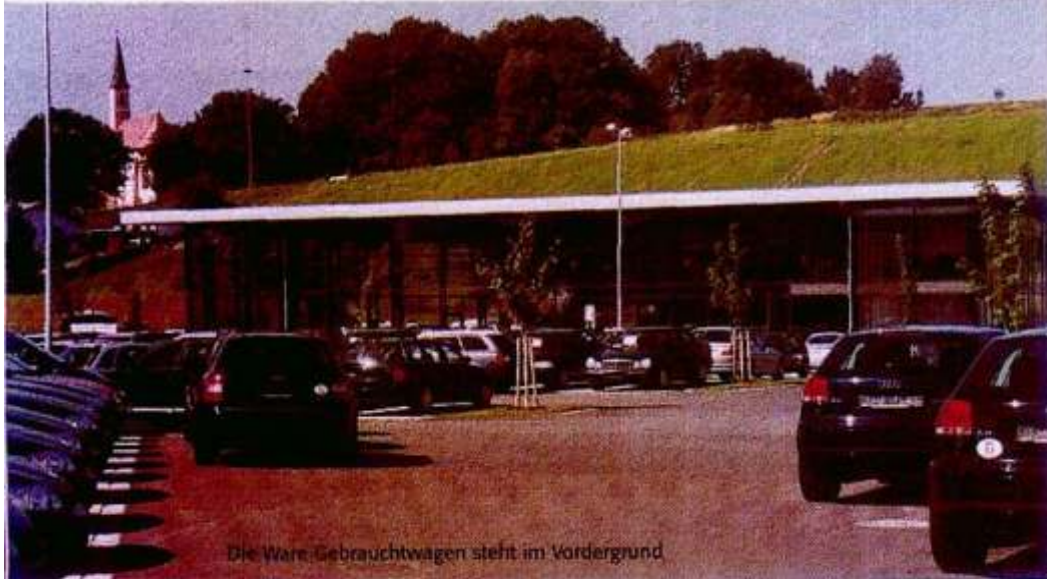
Die Ware: Gebrauchtwagen steht im Vordergrund

fortsetzt, auf der Büros und Besprechungsräume untergebracht sind. Die runde Info- und Annahmetheke im Erdgeschoss findet auf der Galerie ihre Fortsetzung in einem zylindrisch gestalteten Büroraum, der den Blick sowohl auf Ausstellungshalle als auch Verkaufsraum freigibt. Das hier untergebrachte Büro ist Schaltzentrale und Rückzugsraum für Gerhard Schuster. „Mit dieser Lösung haben wir einerseits den Wunsch nach Transparenz, andererseits aber auch das Bedürfnis, ungestört arbeiten zu können, verwirklicht“, erklärt Rickerl.