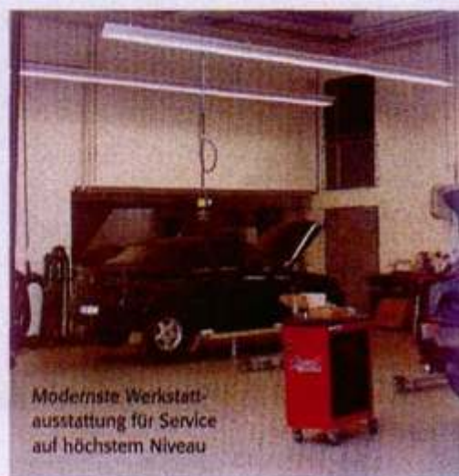
Modernste Werkstattausstattung für Service auf höchstem Niveau

Verwaltung, Verkauf und die eigene Mietwagenfirma Swing. Außerdem ein Aufbereitungscenter für die verkaufsfertige Aufbereitung von Gebrauchtwagen und Privatkundenfahrzeugen.