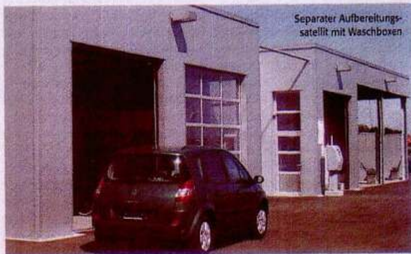
Separater Aufbereitungssatellit mit Waschboxen