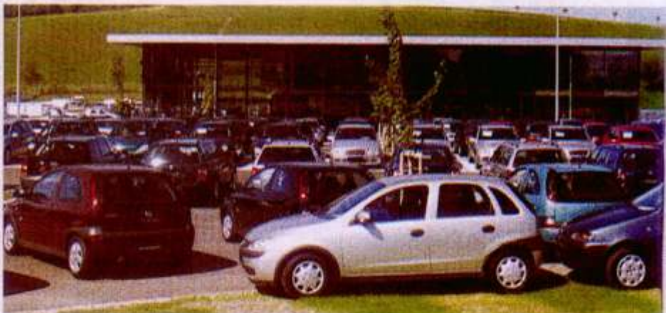
Rund 400 Fahrzeuge hat das Autohaus Schuster ständig im Angebot