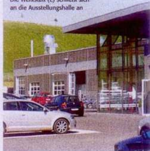
Die Werkstatt (L.) schließt sich an die Ausstellungshalle an

„Bevor wir das Projekt Neubau gestartet haben, hatte ich selber keine Vorstellung davon, wie unser künftiger Betrieb aussehen soll. Ich kann mir architektonische Lösungen erst dann vorstellen, wenn ich sie fertig vor mir sehe.“ Was Schuster allerdings genau wusste, war, welche planerischen Rahmenbedingungen der künftige Betrieb haben sollte. „Wir hatten das Grundstück im neu erschlossenen Gewerbegebiet Hackerwiese, und wir wollten einen Neubau, der genau auf unser Unternehmenskonzept zugeschnitten ist.“ Eckpunkte dieses Konzepts sind der Schwerpunkt im Handel mit ansprechender Präsentation der Fahrzeuge, ein hochmoderner Servicebetrieb, der ausreichend groß dimensioniert sein sollte, um perfekten Service für Privatkunden und die Fahrzeuge aus dem eigenen Fuhrpark zu bieten. Dazu ein ansprechendes Betriebsgebäude mit Ausstellungsbereich und genügend Bürofläche für